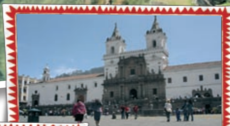
Pompös auf Lateinamerikanisch!