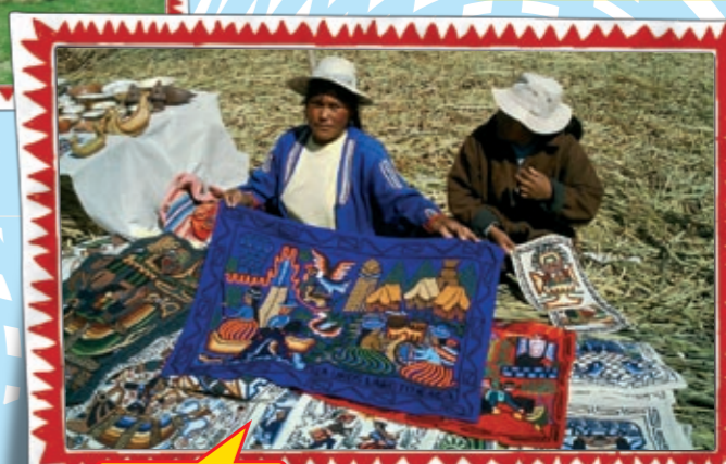
Nicht ganz der Ausverkauf im Mega Orient-Teppich Store...

In Peru buchen wir euch gerne zusätzliche Nächte in Lima.