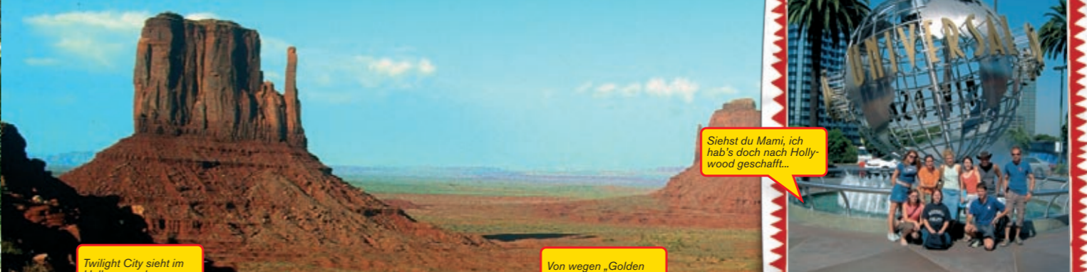
Twilight City sieht im Hellen ganz brav aus...