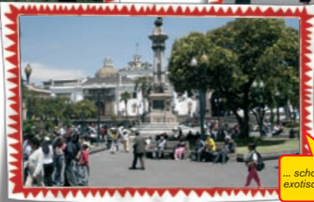
... schon beim exotischen Shoppen!