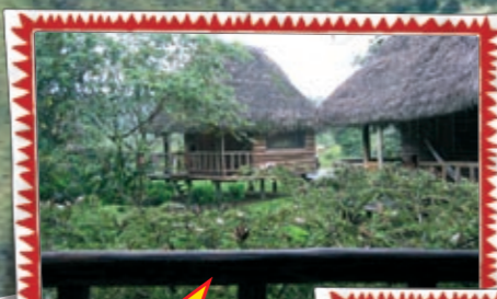
Eben noch im tiefen Dschungel...

Ihr möchtet Ecuador noch besser kennen lernen? Dann bieten sich eine Verlängerungswoche auf den unberührten Galapagos Inseln oder einzelne Tage in Quito und Guayaquil an, wir unterbreiten euch gerne ein Angebot.