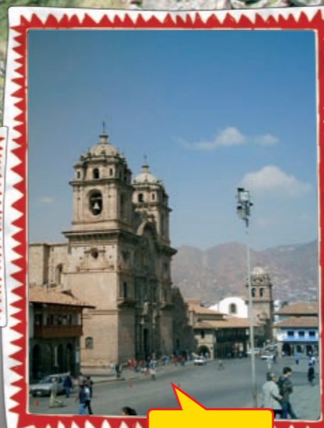
Der Kudamm Perus