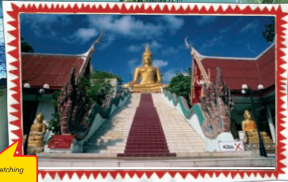
Buddah is watching you!

Rundreise Diese Rundreise bietet euch die wundervolle Möglichkeit die interessantesten Punkte Thailands zu entdecken. Auf unserem Programm stehen die Tempelanlagen Ayutthayas, die antiken Ruinen Sukhothais und Phayoa. Über Chiang Rai geht es nach Chiang Saen und weiter zu einer Longtail Bootsfahrt am berühmten Goldenen Dreieck. Natürlich darf ein Tagesbesuch in Chiang Mai nicht fehlen. Anschließend geht es weiter über Lampang nach Phitsanulok mit Besichtigung des berühmten Wat Mahthats, einem buddhistischen Kloster. Abschließend führt euch der Weg über Lopburi zurück nach Bangkok.